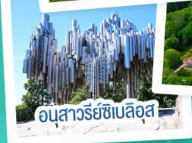
อนุสาวรีย์ซีเบลิอุส

ฟินแลนด์ - เอสโตเนีย - ลัตเวีย - ลิทัวเนีย แวะเที่ยวเซี่ยงไฮ้