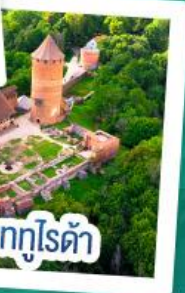
ปราสาทกูโรต้า