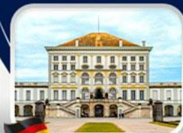
พระราชวังนัมเฟนบูร์ก