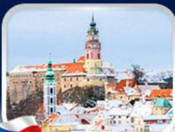
เมืองเชสกี้ กลุมลอฟ