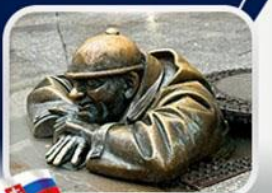
ประติมากรรม Cumil

มาเรียนพลักซ์ • บ้านเกิดโมสาร์ท • พระราชวังฮอฟบวร์ก • ซาลส์บวร์ก • บ้านเกิดโมสาร์ท • เกรโกเดร์สตรีก • ทะเลสาบคอนิกซ์ • หมู่บ้านอัลล์สตัดท์ • อนุสาวรีย์มาเรียเทเรซา