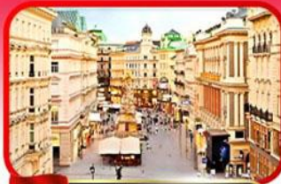
ย่านคาร์กเนออสตรีก