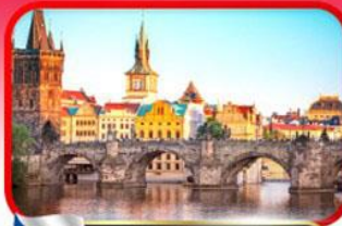
เขื่อนอินสพานชาร์ลส์