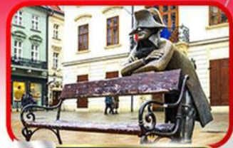
ย่านเมืองเก่าราติสลาวา

เที่ยวเมืองสวยริมทะเลสาบ ฮัลล์สตัดท์ • ชมเมืองไข่มุกแห่งโบฮีเมีย เซสกี กรุงลอน • ปราก • เวียนนา • ซอปปิงพาร์นดอร์ฟ เอาก์เล็ท