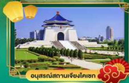
อนุสรณ์สถานเจียงไคเชก