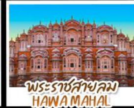
พระราชสาลม HAWA MAHAL