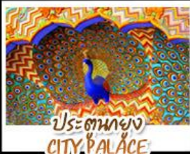
ประตูทอง CITY PALACE