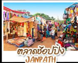
ตลาดช้อปปิ้ง JANPATH