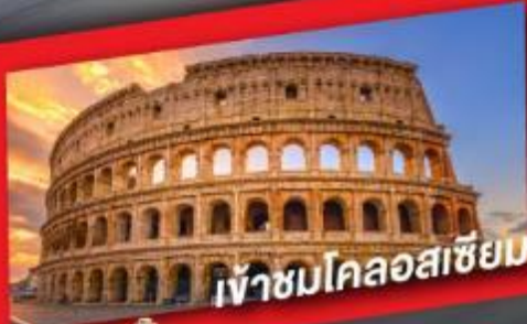
เข้าชมโคลอสเซียม