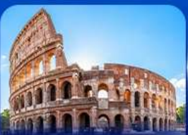
เชิควินดีง โคลอสเซียม โรม