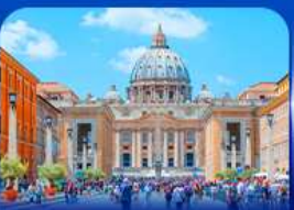
นครรัฐวาติกัน โรม