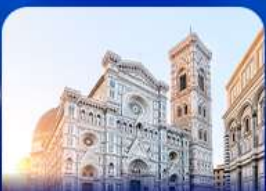
ชมเมืองแห่งศิลปะ ฟลอเรนซ์