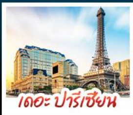
เดอะ ปารีสเซียน

สัมผัสบรรยากาศ เดอะ เวเนเซียน มาท้าวูไ้ เสมือนได้เยือนลาสเวกัส ชมความวิจิตรตระการตาของพระราชวังหยวนหมิงหยวนใหม่แห่งงูไห่ เช็กอินกับแลนด์มาร์กสุดฮิตจตุรัสฮวาอิงถ่ายุรูปกับหอทีวีของกวางเจา เที่ยวชมหมู่บ้านสไตล์ยุโรปแห่งใหม่ของเซินเจิ้น • ช้อปปิ้งเพลิน ๆ ที่ห้างสรรพสินค้า COCO PARK ถนนคนเดินฟู้หัวหลี่และถนนคนเดินบิกกิ้ง