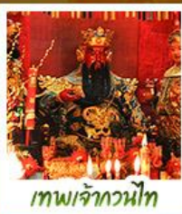
เทพเจ้ากวนไท