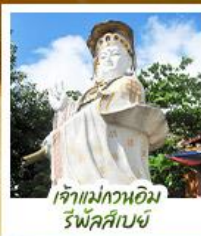
เจ้าแม่กวอเอิมรพีลส์บย