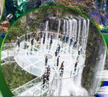
สะพานแก้วคู่หลงเซี่ยะ