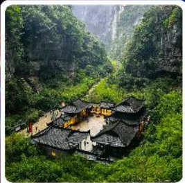
อุทยานแห่งชาติหลุมบ่อฟ้า

ไฮไลท์! อุทยานแห่งชาติหลุมบ่อฟ้า มรดกโลกระดับ 5A รถไฟฟ้าทะลุติ๊ก ตึกตะก๊อบ อลังการการแสดงสียงหยาดัง