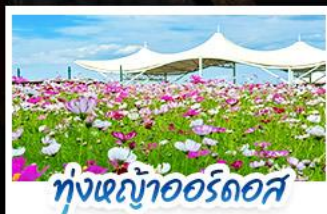
ทุ่งหญ้าแอร์ดอส