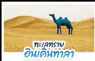
ทะเลทราย อินคินทาลา