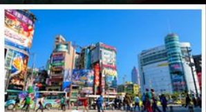
ซ้อปิ้งซีเหมินตง