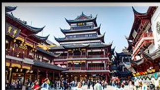
ตลาดร้อยปีฉงหวงเหมียว