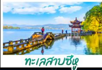
ทะเลสาบซิง

ไฮไลท์ ดิสนีย์แลนด์ เซี่ยงไฮ้ ติวการ์ตูนมิกกี้เมาส์ ทะเลสาบซิง - วัดพระหยก ตลาดร้อยปีเฉิงหวงเมี่ย