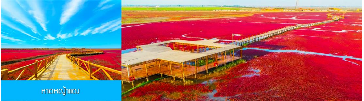
หาดหญ้าแดง

หลังอาหารนำท่านเดินทางสู่ เมืองผานจิน 盘锦 (ระยะทาง 170 กม. ใช้เวลาเดินทางราว 2 ชั่วโมงเศษ)