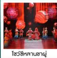
โชว์ซีหลานซาผู้