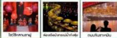
โซ่วซีหลานซาญู