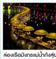
ส่องเรือมังกรแม่น้ำก้งซุย