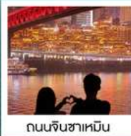
ถนนจินซาเหมิน