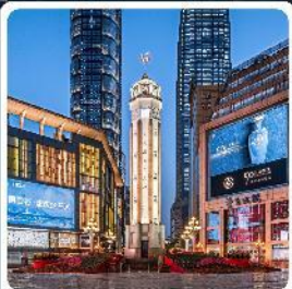
ถนนเจียฟางเป่ย์