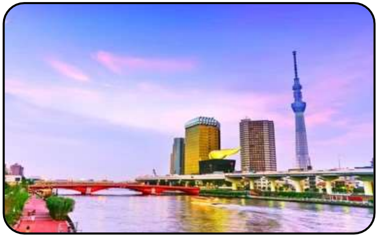
แม่น้ำสุมิตะ

สักการะ วัดมัตสึจิยามะโชเต็น หรือ “วัดหัวไชเท้า” ซึ่งเป็นวัดเก่าแก่ในย่านอาซากุสะ เป็นวัดเก่าแก่ในย่านอาซากุสะ กรุงโตเกียว ตั้งอยู่บนเนินเขาเล็ก ๆ ริมแม่น้ำสุมิตะ จุดเด่นคือเป็นวัดที่ขึ้นชื่อเรื่อง “ขอพรด้านการเงิน” โชคลาภ และความสำเร็จในธุรกิจ ส่วนไฮไลต์สำคัญของวัดนี้คือ ไคคอน หรือหัวไชเท้า สัญลักษณ์ศักดิ์สิทธิ์ คนที่นี้เชื่อว่าไคคอนช่วย “ชำระล้างสิ่งไม่ดี” และนำโชคลาภเข้ามา นักท่องเที่ยวมักนำไคคอนไปถวายเพื่อขอพร