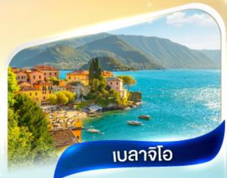
เบลาจีโอ