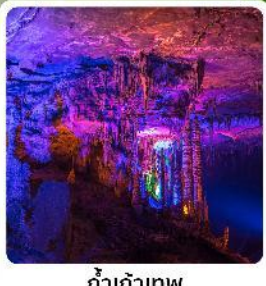
ถ้ำเก้าทพ