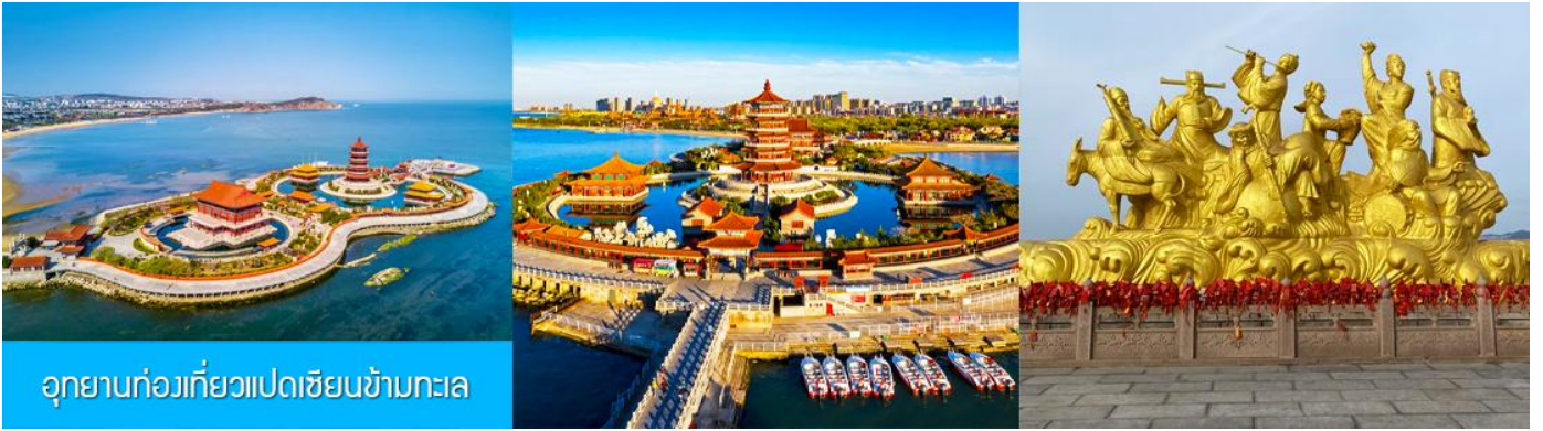
อุทยานทงเกี้ยวแปดเซียนข้ามทะเล