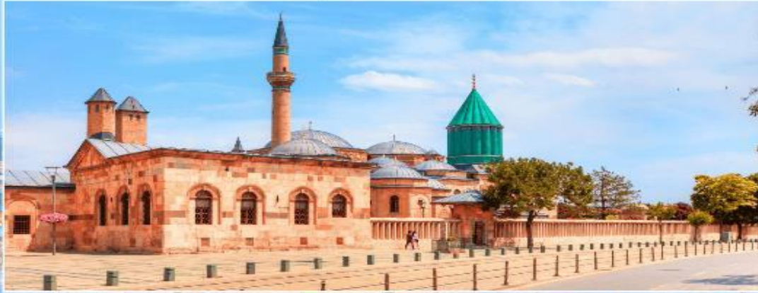
พิพิธภัณฑ์เมฟลานา KONYA

เดินทางสู่ เมืองปามุกคาล่ (PAMUKKALE) แปลว่า ปราสาทพุยฝ้าย อยู่ในเมืองชื่อเดียวกัน จังหวัดเดนิซลี ประเทศตุรเคีย เป็นเนินเขาหินปูนสีขาว มีความยาวประมาณ 2.7 กิโลเมตร สูง 160 เมตร เกิดจากน้ำพุร้อนที่นำแคลเซียมคาร์บอเนตมาตกตะกอน ปามุกคาล่ ได้รับการขึ้นทะเบียนเป็นแหล่งมรดกโลกร่วมกับฮีเอราโปลิสซึ่งเป็นเมืองโบราณที่ตั้งอยู่บนปามุกคาล่ ใน พ.ศ. 2531 (ใช้เวลาเดินทางประมาณ 5 ชั่วโมง)