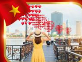
เช็กอินสะพานแห่งความรัก