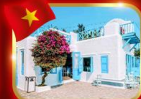
คาเฟ่สุดชิค ซานทรา มาริน่า