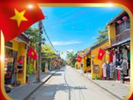
เมืองมรดกโลก ฮอยอัน