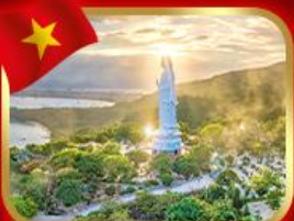
ขอพรกวณอิม วัดหลินอึ้ง