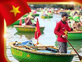
เรือกระด้ง หมู่บ้านกิมทาน