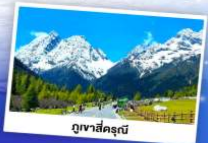
ภูเขาสี่ครุณี