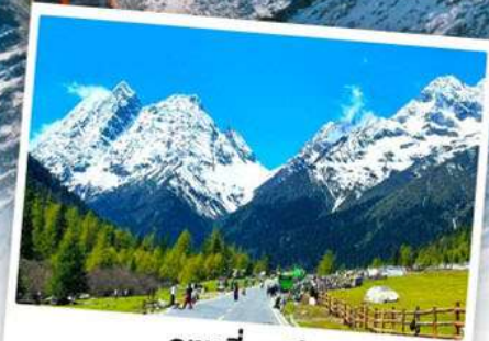
กุเวาสีครุณี

เดินทางโดย: สายการบินเฉิงตูแอร์ไลน์ (EU)