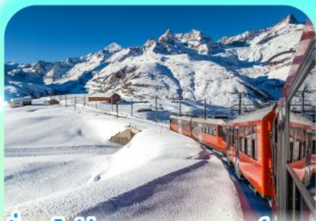
นั่งรถไฟสู่ยอดเขารอนเนอร์เกรต