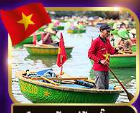
เรือกระด้ง หมู่บ้านกิมกาน