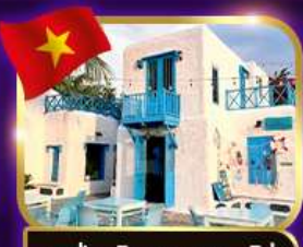
คาเฟ่สุดชิค ซานทรา มาริน่า