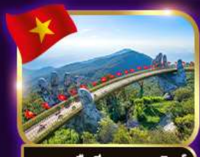
สะพานมือสีทอง บานาฮิลล์

เวียดนาม ดานัง ฮอยอัน พักบานาฮิลล์ 4วัน3คืน เดินทาง เม.ย. - มิ.ย. 69