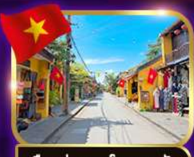
เมืองเก่ามรดกโลก ฮอยอัน