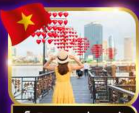
เช็คอินสะพานแห่งความรัก