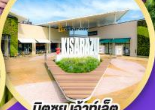
มิตซูเอะอิเกะ พาร์ค คิชะระชู