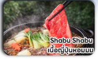
Shabu Shabu เนื้อญี่ปุ่นหอมมัน