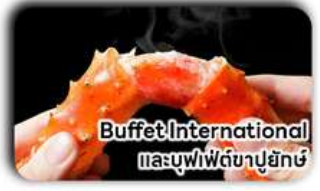
Buffet International และบุฟเฟ่ต์ญี่ปุ่นยักษ์