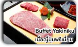
Buffet Yakiniku เนื้อญี่ปุ่นพรีเมียม