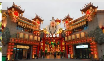
เมืองจำลองวัฒนธรรมคุนหลุน