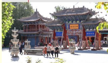
วัดพระใหญ่จางเย่