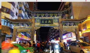
ตลาดกลางคืนถนนม่อเจีย