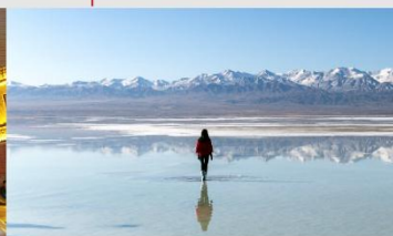
ทะเลสาบซิงไห่

*ทางบริษัทฯ ขอสงวนสิทธิ์ในการสลับโปรแกรมทัวร์ตามความเหมาะสมขึ้นอยู่กับสถานการณ์หน้างาน โดยคำนึงถึงผลประโยชน์ของลูกค้าเป็นสำคัญ