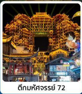
ตีทมหัดจรรย 72