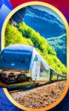
รถไฟฟลิมสขาน่า