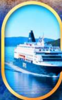
นั้งเรือ DFDS