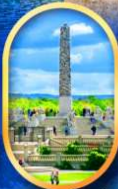
วิกเกอร์แลนด์