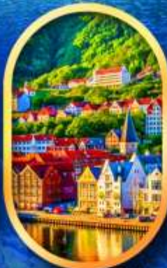
พิกเมืองเบอร์เก็น