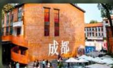
ดงเจียวจี้