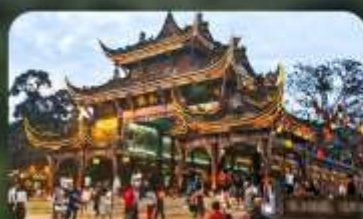
เมืองโบราณกวนเสี้ยน