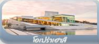
โอปราเฮาส์

สักครั้งในชีวิตกับการนั่งรถไฟสายโรแมนติคฟลัมสบนาน่า สองเรือชมฟยอร์ด ขึ้นกระเช้าลอยฟ้าพิชิตยอดเขาอูสริเคน เบอร์เกน นั่งรถรางสวยอดเขาฟลอมอนชมวิวเมือง ออสโล เยี่ยมชมโอปราเฮาส์ มหาวิหารออสโล ป้อมปราการอาครส์ฮูส สวนอนุชชาติ Vigeland Sculpture Park