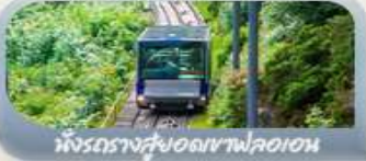
นั่งรถรางสวยอดเขาฟลอมอน