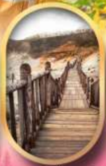
หุบเขาจิกุกาชิ