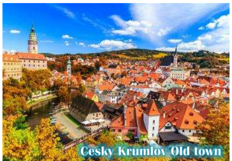
Cesky Krumlov Old town

บ่าย นำท่านเดินทางสู่ “เมืองเชสกี้ ครุมลอฟ (เมืองมรดกโลก)” เป็นเมืองขนาดเล็กในภูมิภาคโบฮีเมียใต้ของ สาธารณรัฐเช็กมีชื่อเสียงจากสถาปัตยกรรม และศิลปะของเขตเมืองเก่าและปราสาทครุมลอฟ ที่ยังคงมีเสน่ห์เหมือนอยู่ในเทพนิยายมาจนถึงทุกวันนี้ และน่าจะเป็นเมืองที่สวยงามที่สุดใน สาธารณรัฐเช็ก, เชสกี้ ครุมลอฟได้รับการจัดอันดับให้อยู่ในสิบเมืองที่สวยงามที่สุดในโลก เป็นหนึ่งในสถานที่ที่สวยงามที่สุดและไม่ควรพลาด ในการเดินทางไปสาธารณรัฐเช็ก เดินเล่นไปบนถนนในยุคกลาง ปราสาทสไตล์บาโรกที่ไม่บุบสลาย และแม่น้ำที่คดเคี้ยว เมืองเก่าที่งดงามแห่งนี้ได้รับการอนุรักษ์ไว้อย่างดีจากอดีตและการทิ้งระเบิดใน สงครามโลกครั้งที่ 2 ทั้งหมดทำให้เมืองที่มีทิวทัศน์แห่งนี้รู้สึกเหมือนอยู่ในเทพนิยายจากยุคกลางสู่ความเป็นจริง