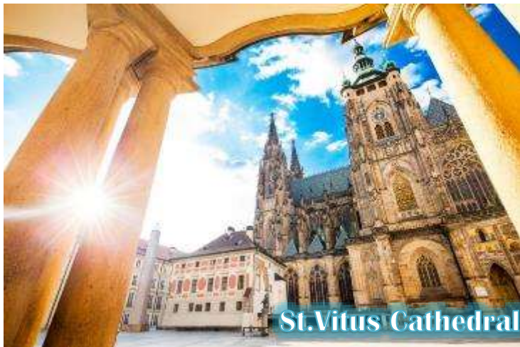
St. Vitus Cathedral