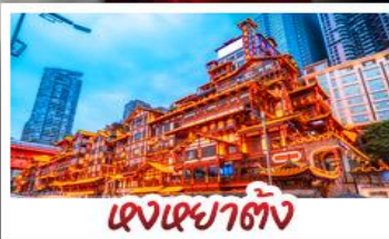
เจงเฉาตั้ง