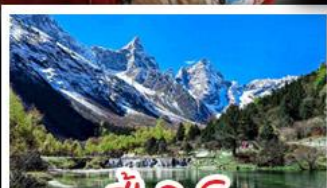
ปี้ผิงโกว