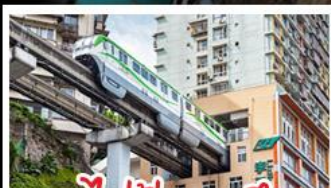
รถไฟไฟทะเลสาบ