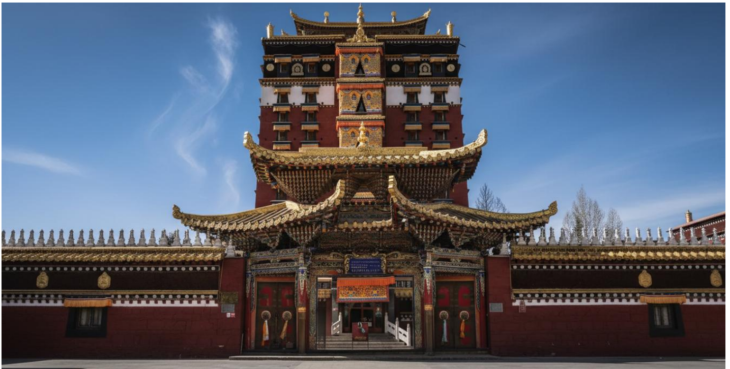
บ่าย นำท่านเดินทางสู่ หอพระมิลारेปะ (ระยะทาง 134 ก.ม. ใช้เวลาเดินทางประมาณ 2 ชั่วโมง) สู่ใจกลางศรัทธา หอพระ 9 ชั้น มิลारेปะ สถาปัตยกรรมทางพุทธศาสนาที่น่าอัศจรรย์ใจและเป็นหนึ่งเดียวใน