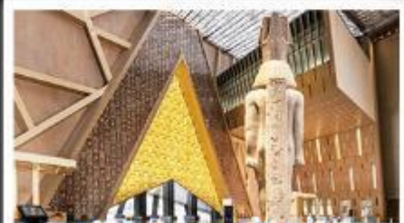
พิพิธภัณฑ์แกรนด์อียิปต์(GEM)

อารยธรรมลุ่มแม่น้ำไนล์ - พีระมิด - อเล็กซานเดรีย - เมมฟิส - ไคโร - โรงแรมระดับ 4 ดาว รวมค่าวีซ่า ครอบคลุมเอกสาร - อาหารครบทุกมื้อ