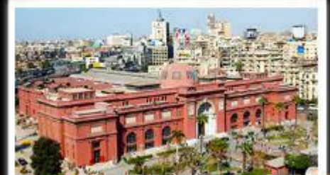
พิพิธภัณฑ์สถานแห่งชาติอียิปต์