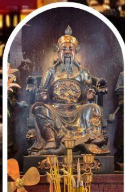
วัดปักไต้ เสริมโชคกลางนำความรุ่งเรืองทุกด้านของชีวิต