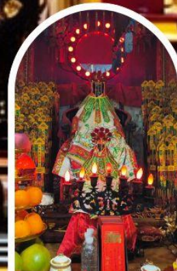
วัดเจ้าแม่กวนอิมอ่องฮำ ขอพรเรื่องเงิน ทรัพย์สิน และความมั่งคั่ง