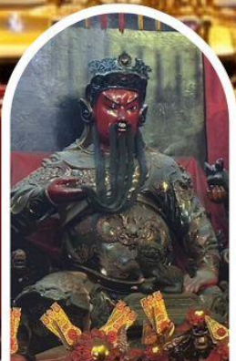
วัดกวนไท่ ขอเทพเจ้ากวนอู ความซื่อสัตย์ เงินทอง ธุรกิจมั่นคง