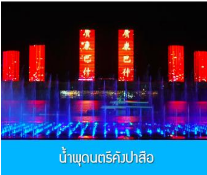
น้ำพุดนตรีคังปาสือ