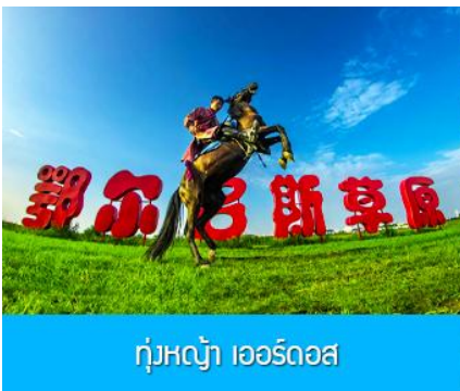
ทุ่งหญ้า เออร์ดอส

พักที่ ORDOS BOYU AIRUI HOTEL โรงแรมระดับ 4 ดาวท้องถิ่น หรือเทียบเท่าในเมืองเออร์ดอส