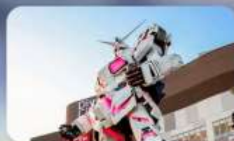
ช็อบบิงโอไดบะ