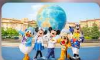
อิสระตามอริยาซึย 2 วัน