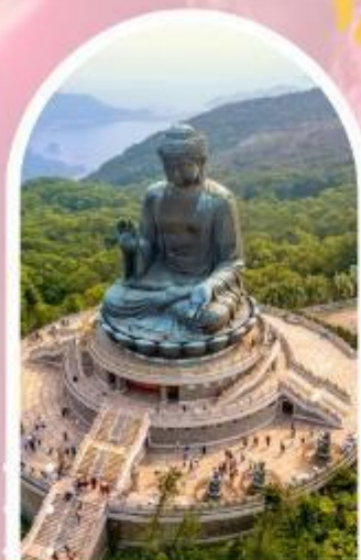
นั่งกระเช้านองปิง นมัสการพระใหญ่ไป่หวลัน