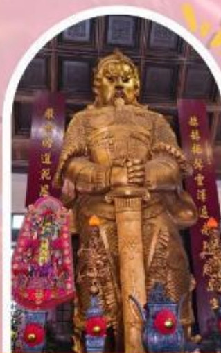
วัดแซกกง ขอพรโชคกลาง การเงิน และธุรกิจ