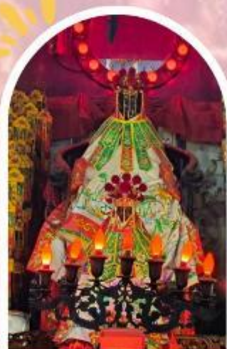
วัดเจ้าแม่กวนอิมอ่องฮำ ขอพรเรื่องเงิน ทรัพย์สิน และความมั่งคั่ง