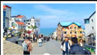
ถนนคอปเพิลิงหมายเลข ๘

สัมผัสความยิ่งใหญ่ของ 4 เมืองสำคัญ ชิงเต่า - เยียนโก - เฟิงไห่ - เว่ยไห่ ปาต้ากวน - โบสถ์คาทอลิก - ตึกเก่าริมหา