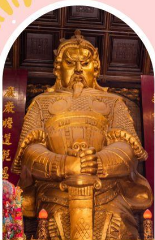
วัดเชกกง