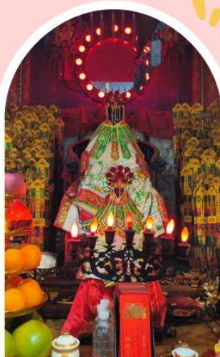
วัดเจ้าแม่กวนอิมฮ่องฮำ

ความสำเร็จ ความมั่งคั่ง เงินทองไหลมาเทมา