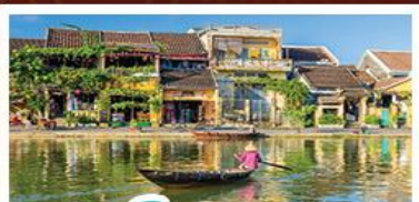
เมืองโบราณเฮอฮอัน

! พักบนเขาน่าฮิลล์ 1 คืน ! สัมผัสอากาศเย็นตลอดปี สตรีตฟรังเศสสุดคลาสสิก - นั่งกระเช้ายาวที่สุด สู่มานาฮิลล์ สนุกสุดมันส์ไปกับสวนสนุก The Fantasy Park มีบริการเจ้าแม่ทงอิมองค์ใหญ่ที่สุดของเมืองดานัง - เช็กอินเมืองมรดกโลกฮอยอัน - สนุกสนานไปกับกิจกรรม!!นั่งเรือกระดิง หมู่บ้านกัมทาน เช็กอินร้านกาแฟ SON TRA MARINA CAFE - ไม่หลงร้านช้อปปิ้ง - อิ่มอร่อยกับบุฟเฟ่ต์นานาชาติ , หม้อไฟซีฟู้ด