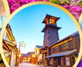
หอรบั้งโทคิโนะคาเนะ