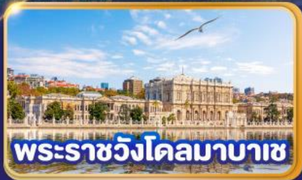
พระราชวังโดลมาบาซ