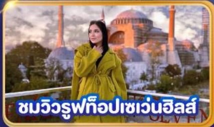
ชมวิวยุโรปเซเวนฮิลส์