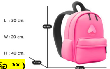
(สายการบินอาจไม่อนุญาตให้นำกระเป๋าที่มีล้อลากขึ้น)

ขนาดมาตรฐาน กระเป๋าใบเล็ก ถือขึ้นเครื่อง ขนาด : ไม่เกิน 30x20x40 cm.